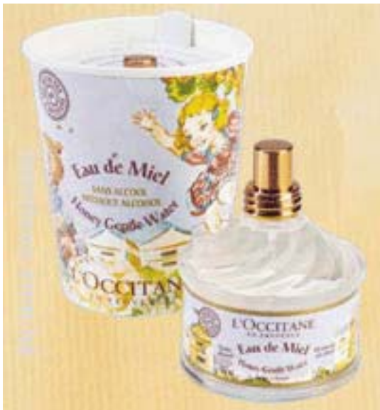
▲ ハニーハーベスト ジェントルウォーター

香りマーケットはしっかり根付きました。そして、フレグランスとタオルはとても近い関係です。ならば、様々な香りをタオルに閉じこめたらどうでしょう。今までも、香りのするタオルはあったように思います。がしかし、売場としてコーナー展開できるほど徹底していませんでした。最近の主流はスイート系で、バニラやストロベリー、ケーキやチョコの香りなど多様化しています。入浴剤の売れ筋もこの系統です。只し販売演出やパッケージング、商品名などターゲットや売場環境に合わせた販売方法がポイントになります。またより個人的なパーソナルギフトとしてもニーズがありそうです。