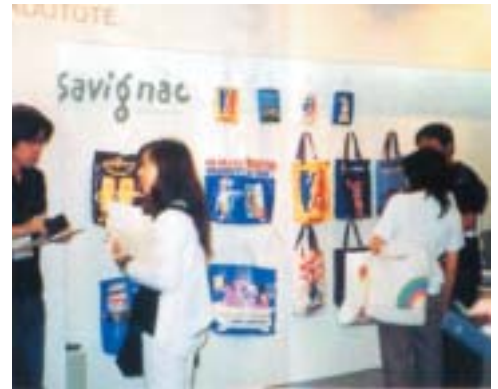
▼サビニャックのトートBAG (スーパープランニング)