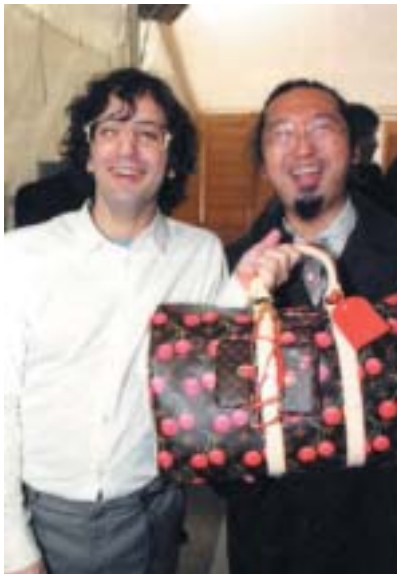
▲▲ 村上隆 ルイ ヴィトンとのコラボレーション