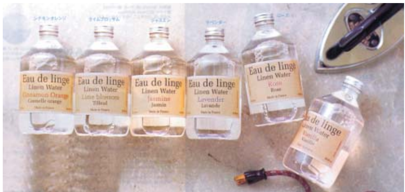
▲ アイロンかけの時に霧吹きに入れて香りを楽しめます。シナモンオレンジ・バニラ・ローズなど