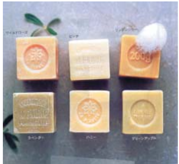
▲ ピーチ・ラベンダー・グリーンアップル バスタイムも楽しい